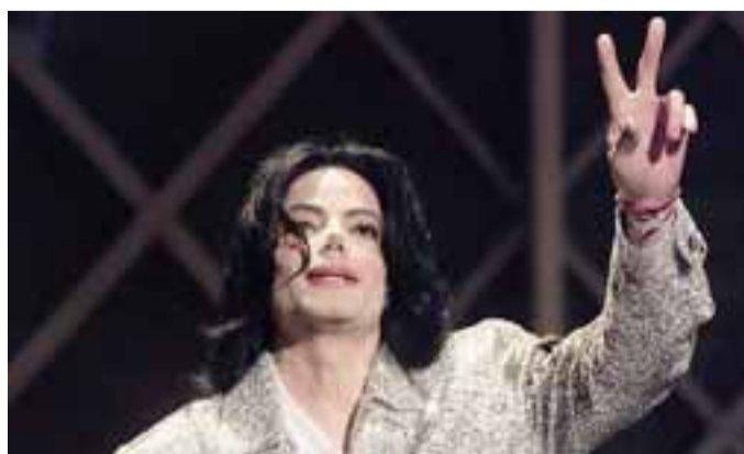
Michael Jackson nel 2002, agli American Music Awards di Los Angeles

Jackson è un artista che ha segnato la storia della musica anche travalicando i confini di genere. Qualche giorno fa, ad esempio, il jazzista Enrico Rava ha dedicato un tributo musica-